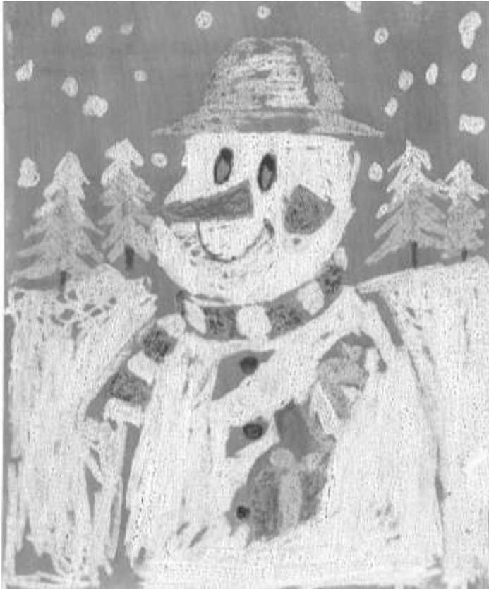
Evka Antalíková, 5.B