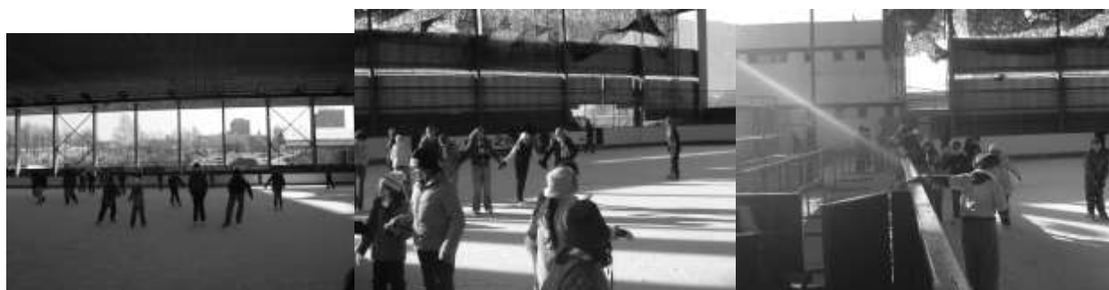
Ako sme sa korčuľovali